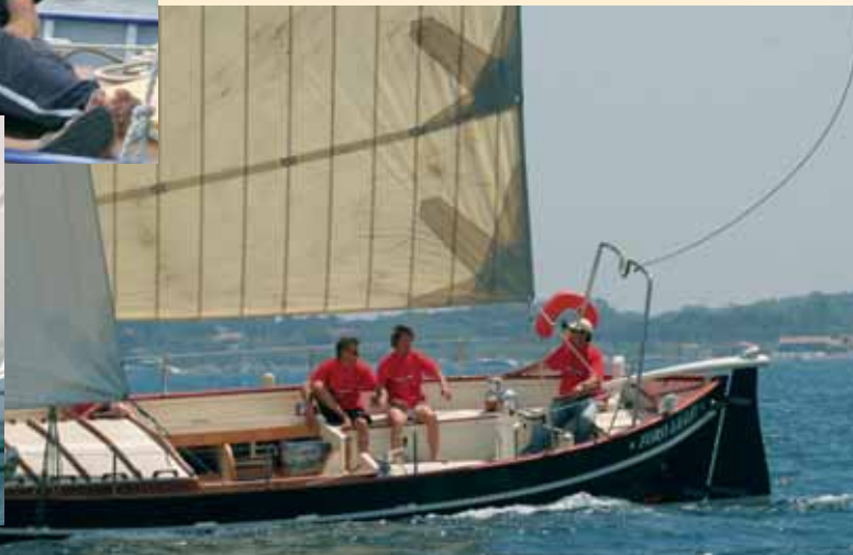
Voiles Latines 2006 par Jean-Louis Chek